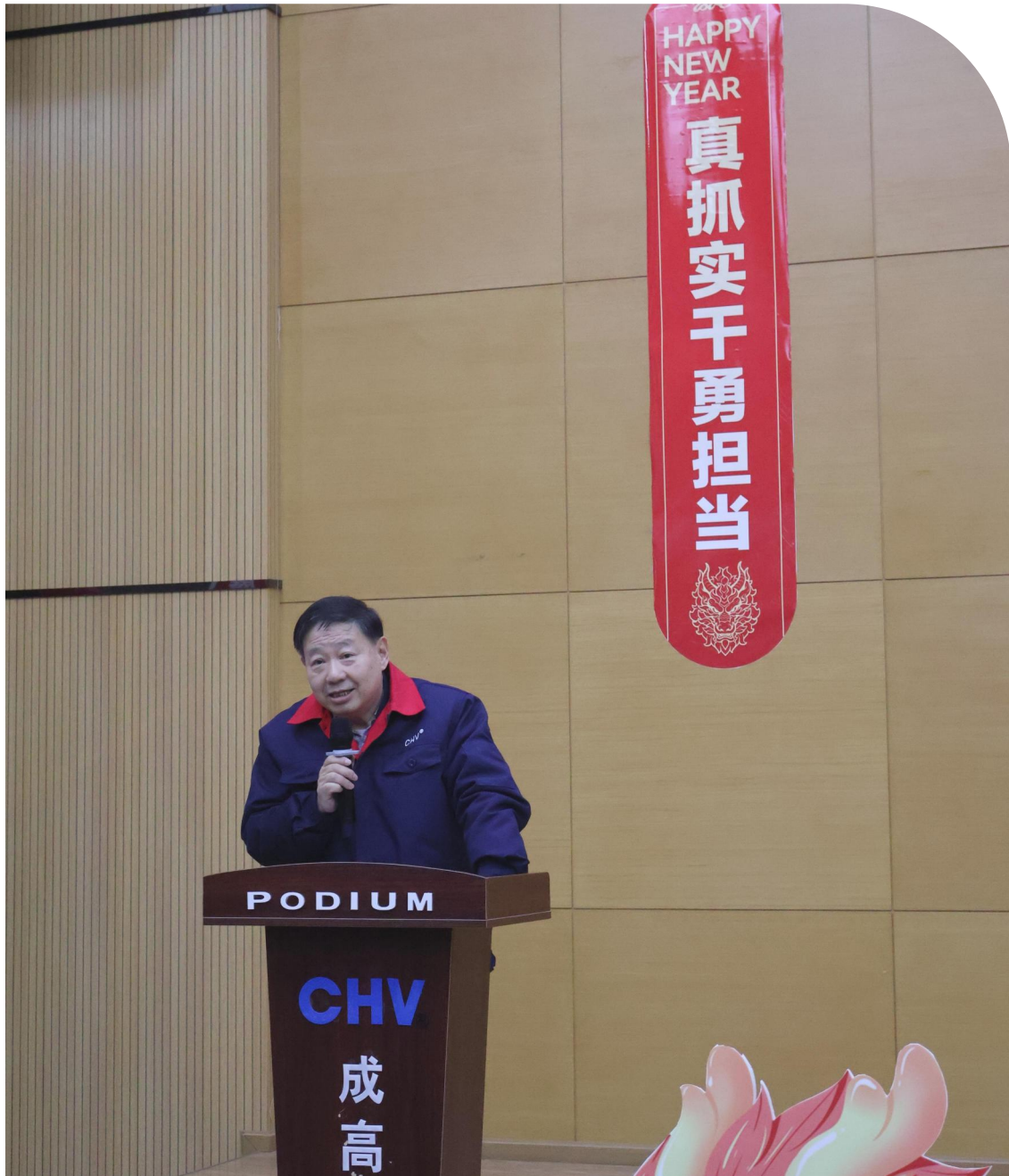
■2024年2月1日，成都成高阀门股份有限公司2023年度表彰大会暨新春文艺汇演。